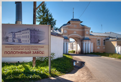
Историко-архитектурный и природный музей-усадьба «Полотняный Завод»